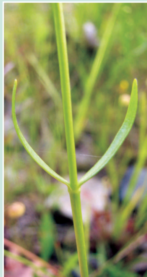
Tige et feuilles étroites