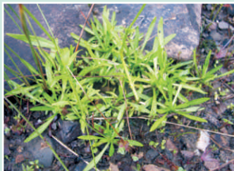
Feuilles par terre (basales)