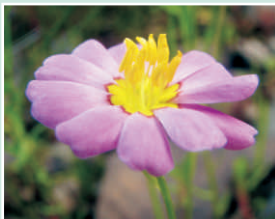
Pétales avec une base jaune, et des étamines jaunes