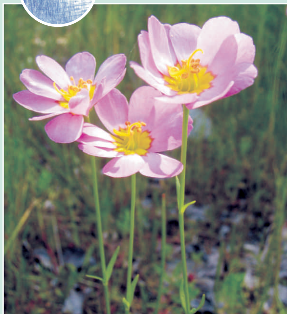
Fleurs avec styles jaunes en forme de fourche